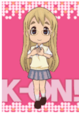
(c)かきふらい・芳文社／桜高軽音部 (c)Butterfly supported by COPRO