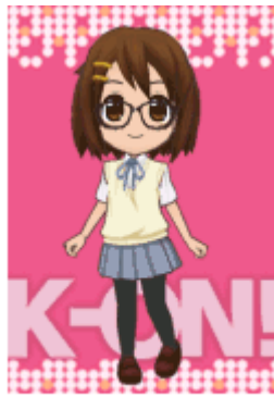
(c)かきふらい・芳文社／桜高軽音部 (c)Butterfly supported by COPRO